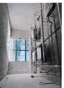
機器・配管類を「見える化」した実習室