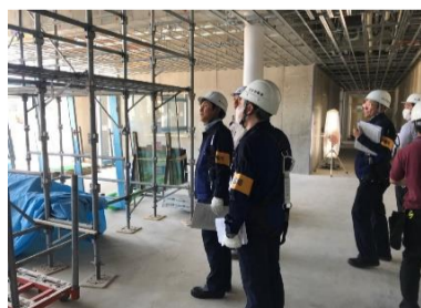
足場作業の安全対策を確認しました。