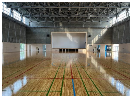
【体育館】床の塗装も完了し、体育器具工事を行っています。