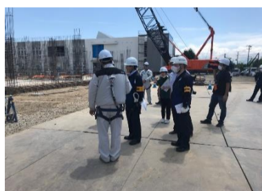
暑い中での安全対策、熱中症対策を見ている。