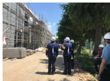
足場解体状況を見ている。