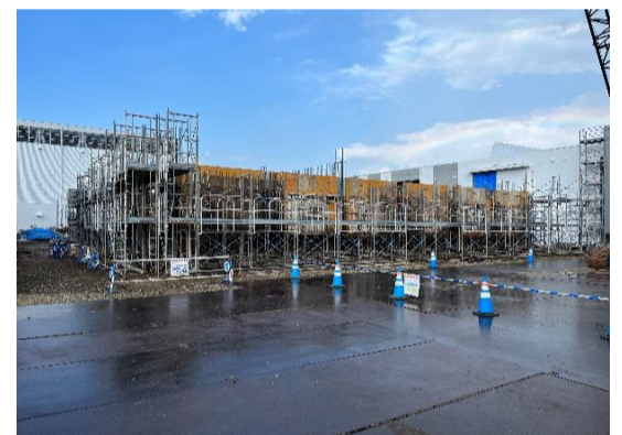
【特教棟】1F躯体の鉄筋、型枠の組立をしています。