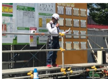
職長代表による安全の誓い。