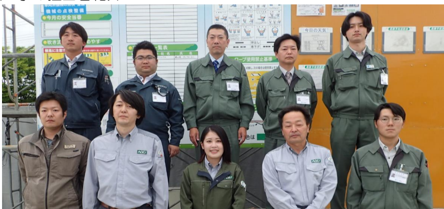
（建築）升川・高木JV（電気設備）東北電化工業（機械設備）弘栄設備工業 私たちが担当します。よろしくお願いいたします。